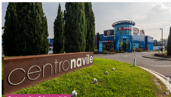
Centronavile - Bologne - Italie

Cet ensemble commercial dispose d'une importante zone de chalandise (700 000 habitants) dans une des régions les plus dynamiques d'Italie du Nord et d'un mix locatif diversifié, avec 8 locataires répartis sur différents segments comme l'ameublement ou l'électronique, bénéficiant de taux d'effort raisonnables.