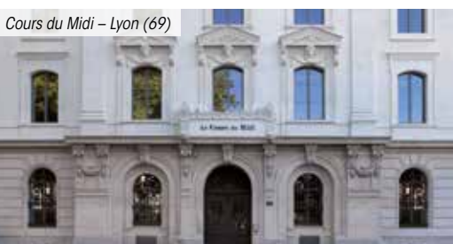
Cours du Midi – Lyon (69)