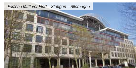
Porsche Mittlerer Pfad – Stuttgart – Allemagne