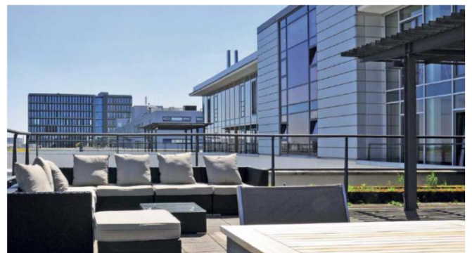
Laimer Atrium Munich