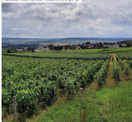
Lieudit Les Tahus - Hautvillers (51)

(2) Disponibles dans le prochain bulletin trimestriel suite à l'arrêté comptable du 31/12.