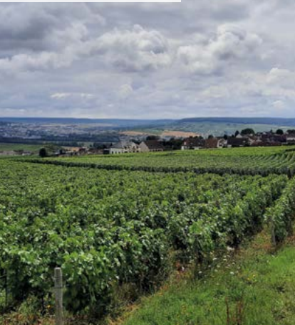
Lieudit Les Tahus - Hautvillers (51)