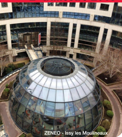
ZENEO - Issy les Moulineaux