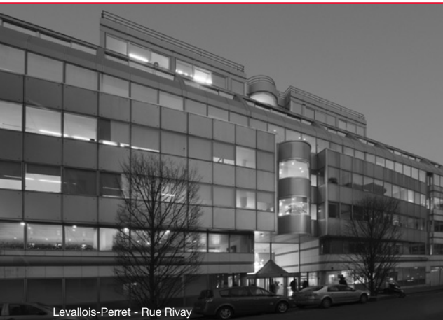
Levallois-Perret - Rue Rivay