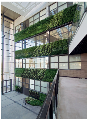
CLAMART (92) - «Le Panoramic»

PFO 2 n'a jamais aussi bien porté son nom : suite à une démarche initiée l'année dernière, PERIAL Asset Management a obtenu au mois de juin 2016 la certification ISO 50001 pour sa SCPI « verte ».