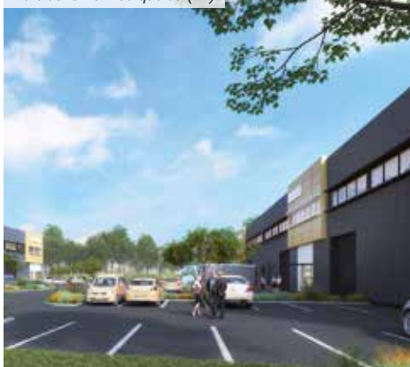
Parc du Terre – Carquefou (44)

*** Pour les non résidents seuls les immeubles détenus en France sont pris en compte.