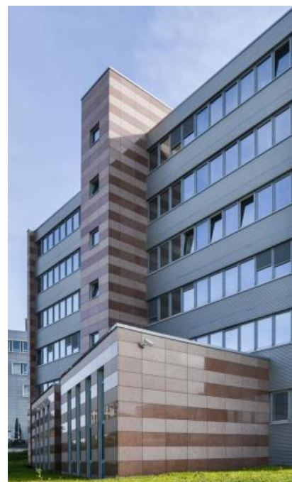
11 ème acquisition – Ratingen Düsseldorf