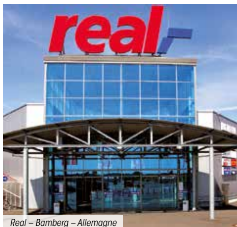
Real – Bamberg – Allemagne

La mesure de cette performance, nette de tous frais, confirme la nature immobilière de cet investissement dont les résultats s'apprécient sur le long terme. Les performances passées ne sont pas un indicateur fiable des performances futures.