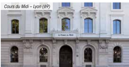
Cours du Midi – Lyon (69)