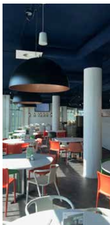
41-63 Neptunustraat Hoofddorp – Pays Bas