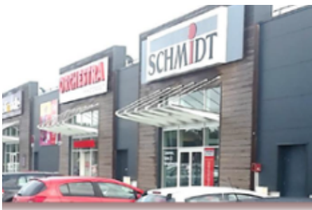
Le Pian Médoc (33)

8 Locataires : Action, Orchestra, Chaussée, Crédit Agricole, Chocolaterie Leonard, Coiffeur, Schmidt et Pavillon de la mutualité Surface : 2 876 m 2