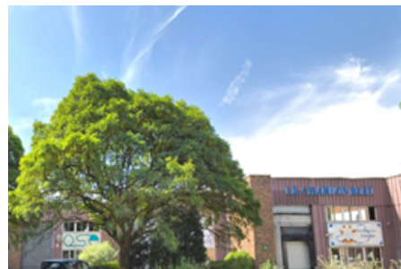
Noisy le Grand (93)

2 Locataires : sociétés de services Surface : 1 515 m 2