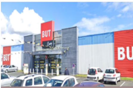
Saint Agathon (22)

3 Locataires : Basic Fit, Gemo et Autosur Surface : 2 918 m 2