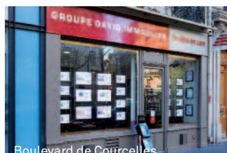
Boulevard de Courcelles