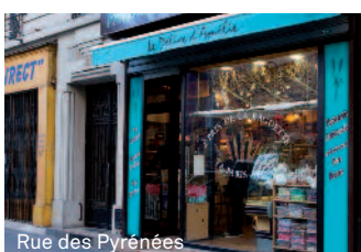
Rue des Pyrénées