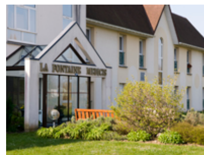
Fontaine Médicis CUCQ (61)

Au cours de ce quatrième trimestre, deux logements ont été acquis dans un EHPAD à CUCQ (62) dénommé FONTAINE MEDICIS. Cette maison de retraite propose de beaux espaces de vie clairs et spacieux, et bénéficie d'un service de qualité. Le lieu est accueillant à proximité de la forêt et de la plage du Touquet.