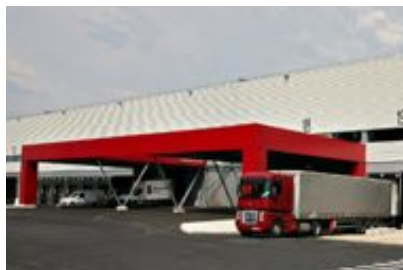
Chatres - Zac Val de Bréon - Bât. 3