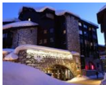
Val d'Isère - L'Aigle des Neiges