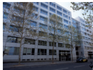
Paris - Pirogues