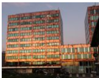
Lille - Le Leeds