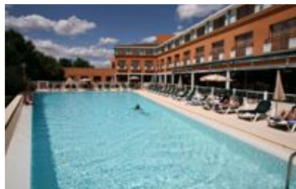
Seilh - Hôtel Golf Mercure