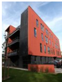
Caluire & Cuire - Cité Park