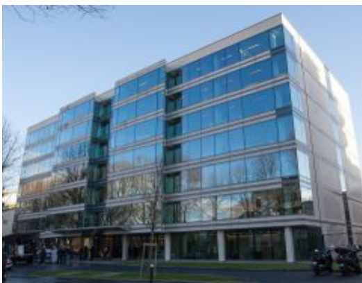
Neuilly sur Seine