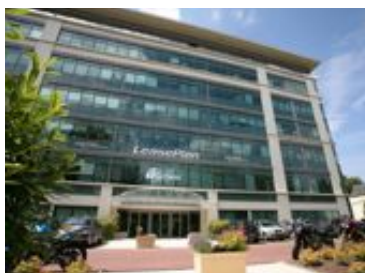
Rueil Malmaison - Avenue Bonaparte