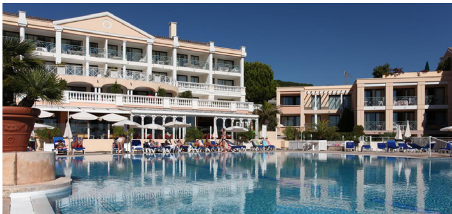
Cannes - Villa Francia