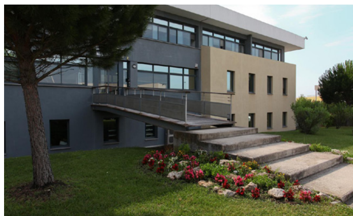
Aix en Provence - Europeole