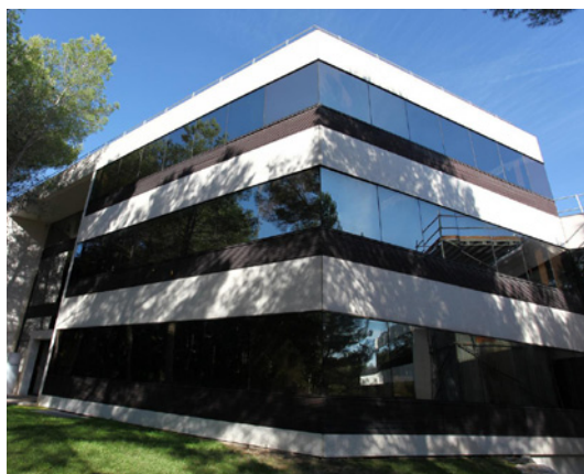
Valbonne - Les Lucioles