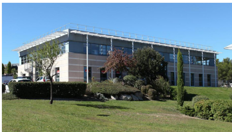
Aix en Provence - Europarc Pichaury