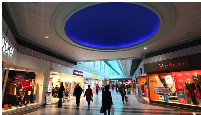
Mérignac - Centre Commercial Mérignac Soleil