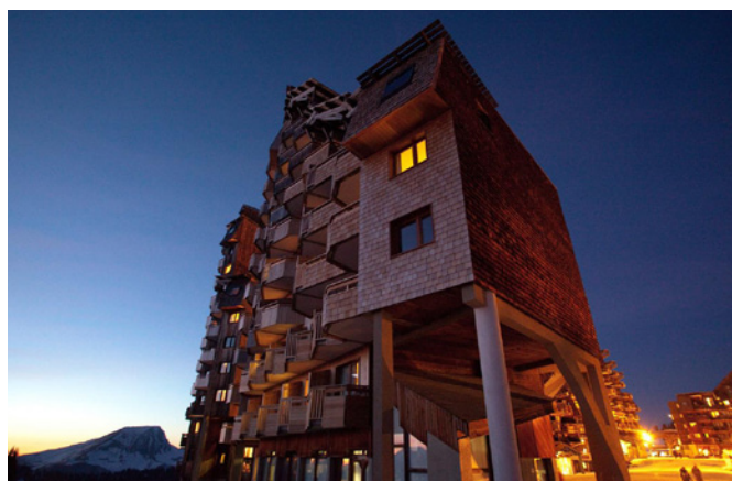
Avoriaz - Hôtel le Saskia