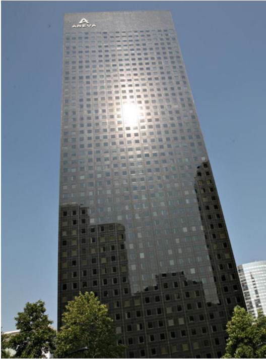
Paris la Défense - Tour Areva