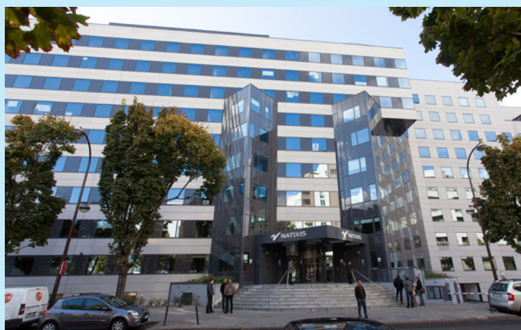
Charenton-le-Pont - nouveau Bercy