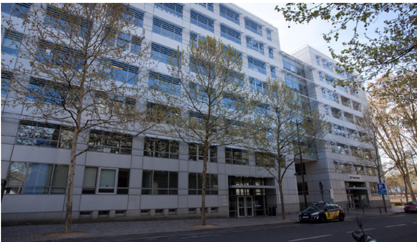
Paris - Rue de Pirogues