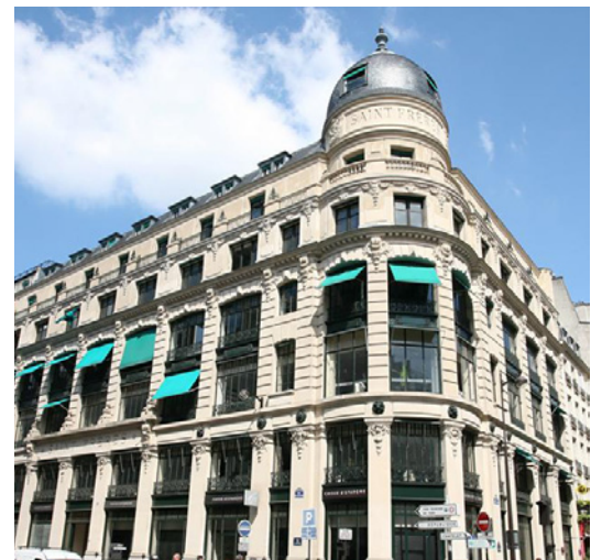
Paris - Rue du Louvre