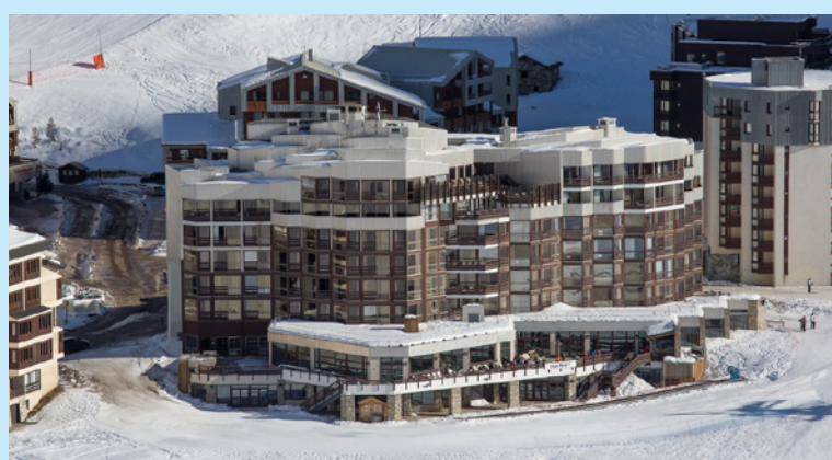
Tignes - Val Claret