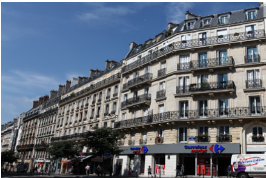
Paris - Rue Maubeuge