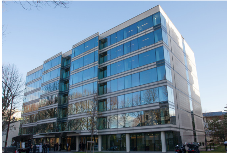
Neully-sur-Seine - Riva