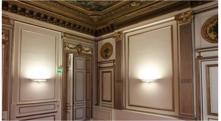
Paris - 136, Avenue des Champs Elysées