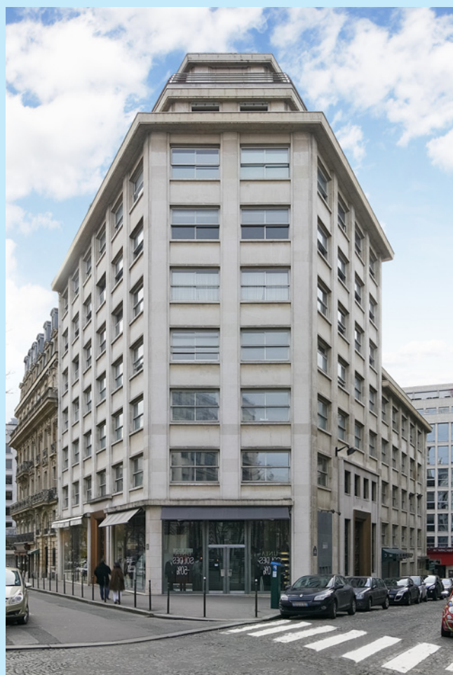
Paris - George V