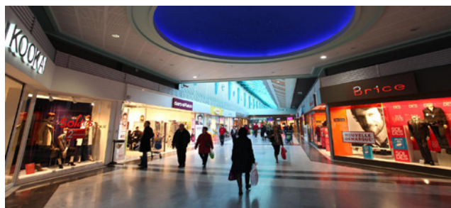
Méridon - Centre Commercial Méridon Soleil