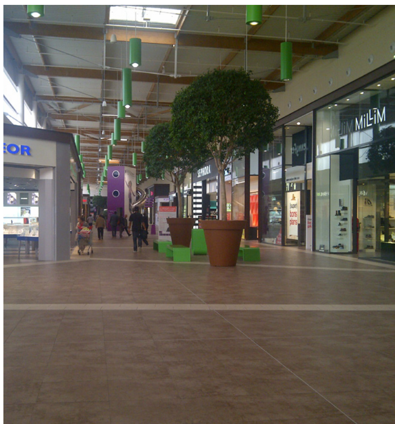
Centre commercial Grand Cap - Le Havre