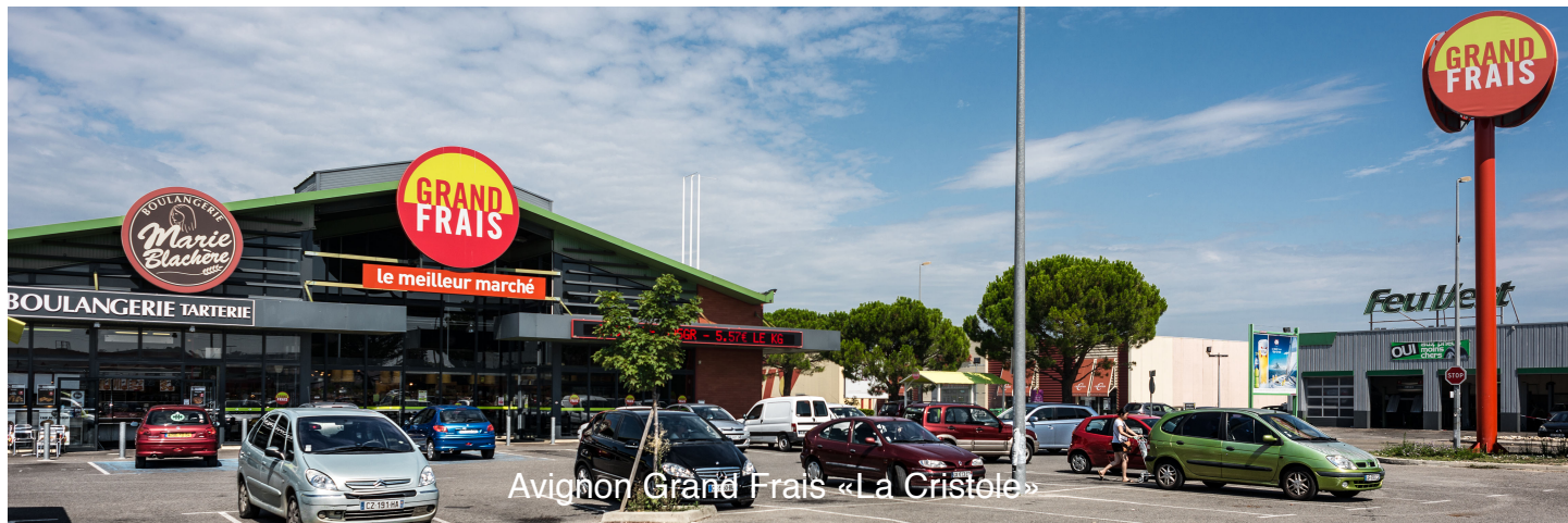
Avignon Grand Frais « La Cristole »

La scpi Cristal Rente clôture son exercice 2014 avec une progression notable de sa collecte, qui lui permet d'approcher les 20 M euros de capitalisation. On rappellera que cette scpi n'est distribuée que par le canal des professionnels de la gestion du patrimoine.