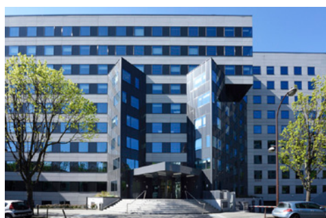
14/18, Avenue du Général de Gaulle - 94220 CHARENTON-LE-PONT