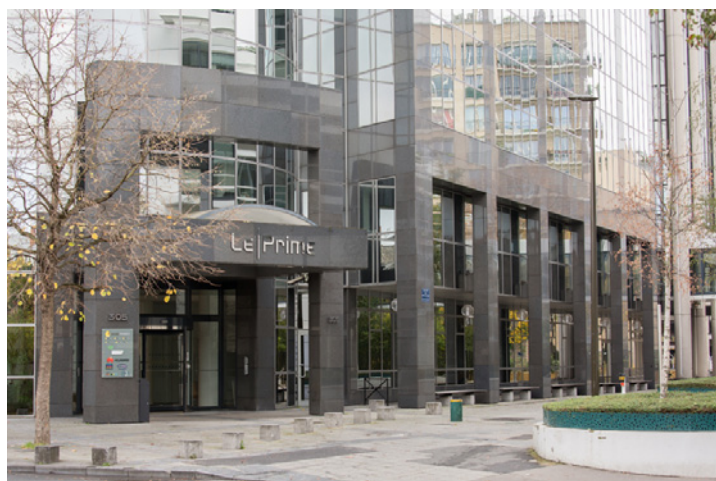
PRIME, 305, Avenue Le Jour se Lève - 92100 BOULOGNE (quote-part de 16,66 %)

* Acquisition (A)/Promesse d'acquisition (PA) - ** Acte en main - *** Hors taxes/Hors charges - (1) Toutes les données sont indiquées en quote-part Genepierre.