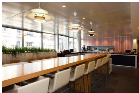
70, Rue Rivay - 92300 LEVALLOIS-PERRET