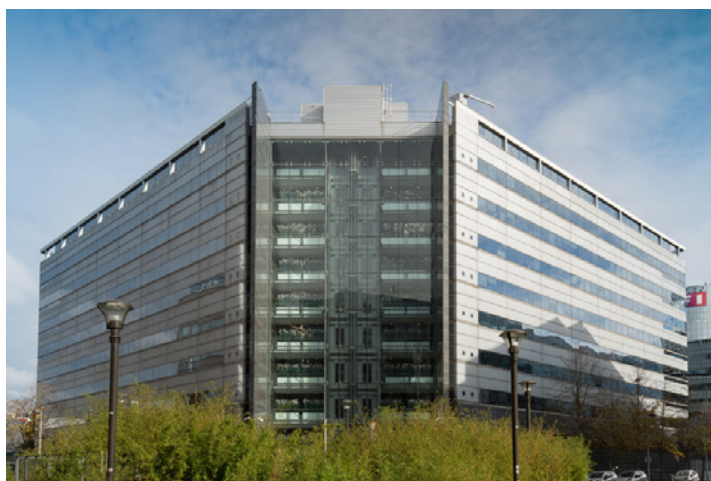
ATRIUM, 6, Place Abel Gance - 92100 BOULOGNE (quote-part de 10 %)