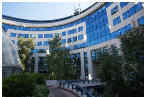
14, Boulevard des frères voisin - 92130 ISSY-LES-MOULINEAUX