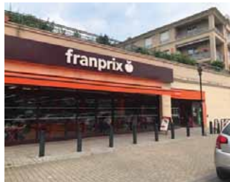
53 avenue Joffre 77450 ESBLY