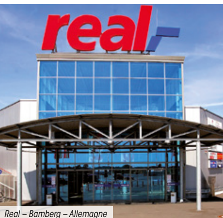
Real – Bamberg – Allemagne