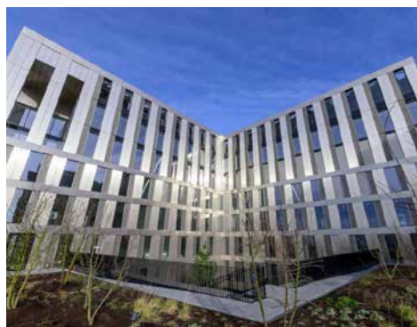
81 rue Mstislav Rostropovitch - 75017 Paris