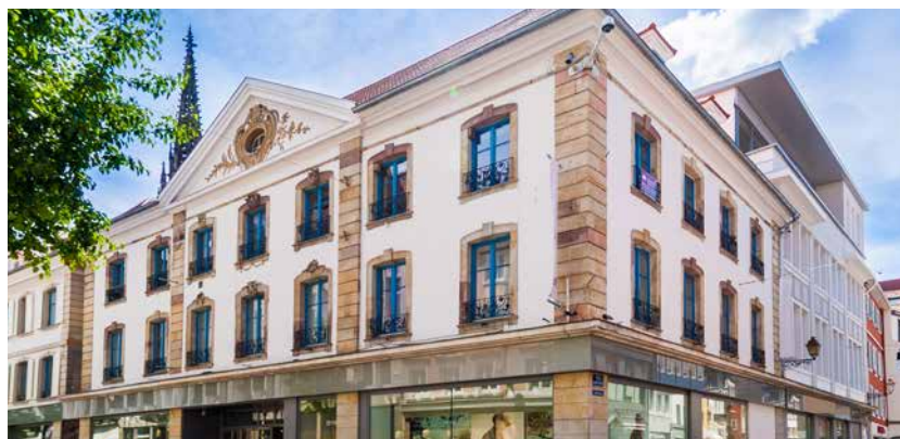
37/39 rue Sauvage - 68100 Mulhouse