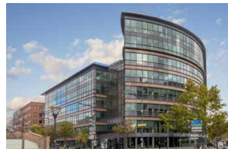
266 avenue du Président Wilson - 93210 Saint-Denis