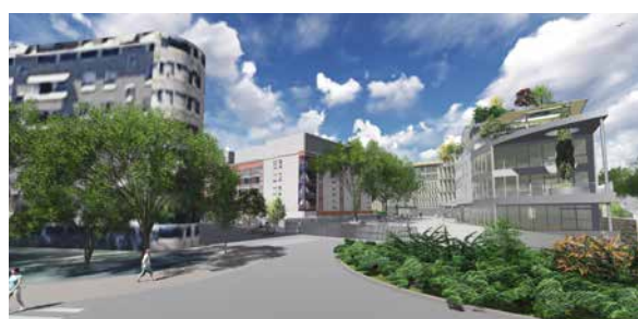
2 avenue Pasteur - 2 avenue Pasteur - 94160 Saint-Mandé - VEFA