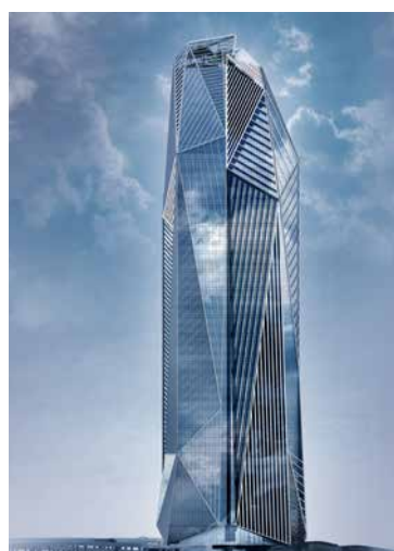
Tour Hekla - Avenue du Général de Gaulle La Défense - 92800 Puteaux - VEFA