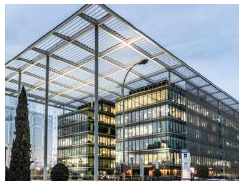
La Mahonia 2 - Madrid - Espagne