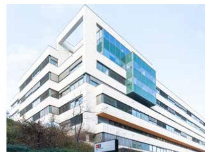
Maria Jacobi Gasse 1, 1030 Vienne - Autriche