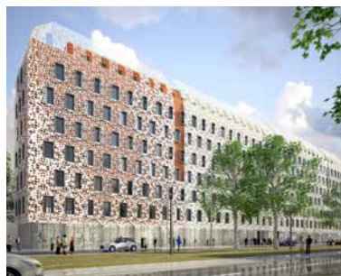
42 boulevard de Dunkerque - 13002 Marseille VEFA