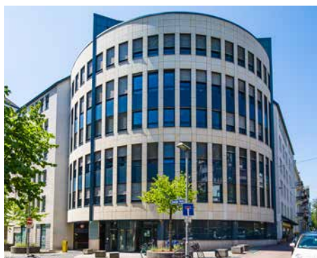
BBW – Grafstrasse / Wildungerstrasse Francfort - Allemagne