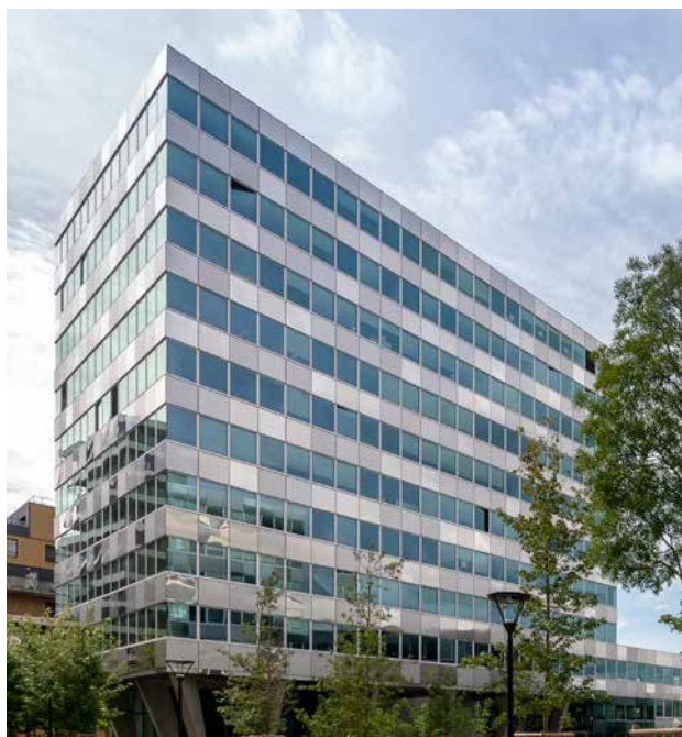
6-8 rue Nathalie Lemet - 44000 Nantes