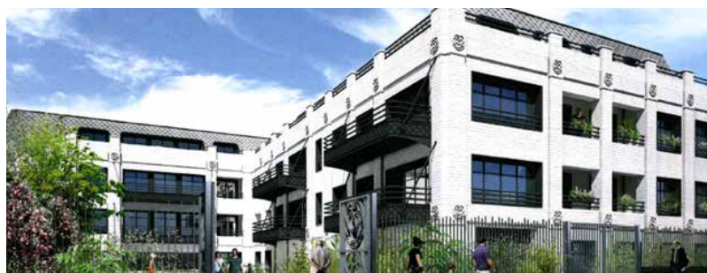
114 avenue Henri Barbusse - 92600 Asnières sur Seine VEFA