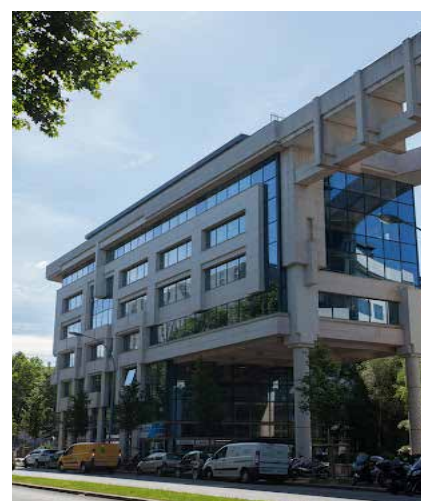
Colisée Marceau - 10 bd des Frères Voisin 92130 Issy-Les-Moulineaux