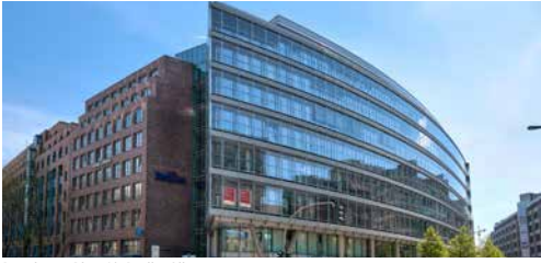
Postdamer Platz 10, Berlin, Allemagne