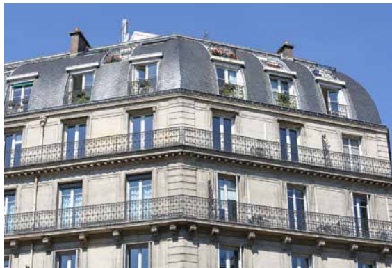
31 avenue de l'Opéra - 75001 Paris