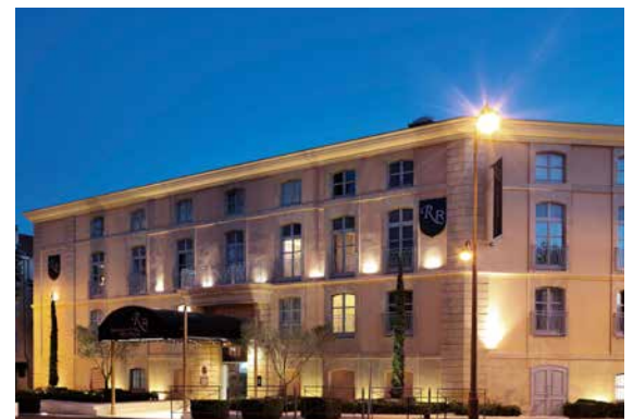
24 boulevard du Roi René - 13100 Aix en Provence