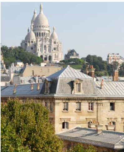
39 avenue Trudaine - 75009 PARIS (VEFA)