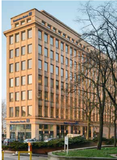
13-17 Marnixlaan 1000 Bruxelles, Belgique