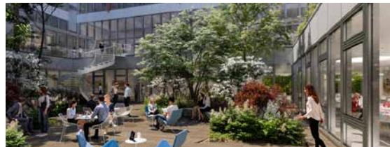
L'Académie 89-91 rue Gabriel Péri - 92120 Montrouge (VEFA)