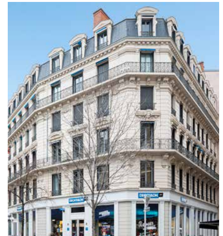
3 rue Président Carnot - 69002 Lyon