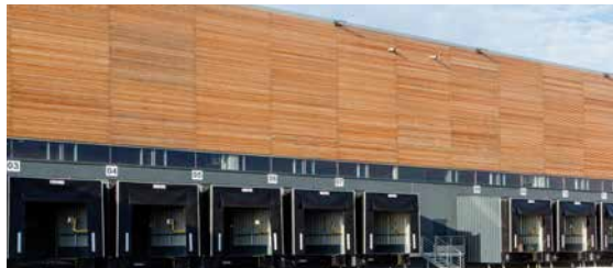
Zac de la Butte aux Bergers - 95380 Louvres