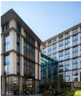
2-8 rue Ancelle - 92200 Neuilly-sur-Seine