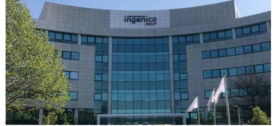
41-63 Neptunstraat Hoofddorp, Pays-Bas