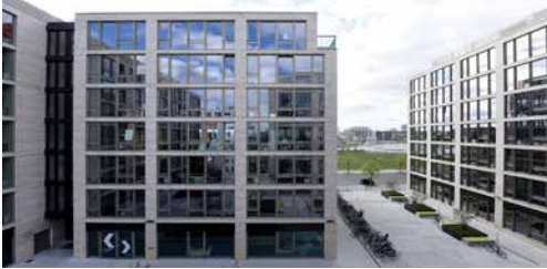
16-19 Mühlenstrasse Berlin, Allemagne