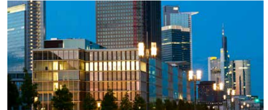
Europaallee 12-22, 60327 Francfort, Allemagne