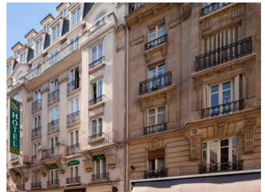
330 rue de Vaugirard - 75015 Paris