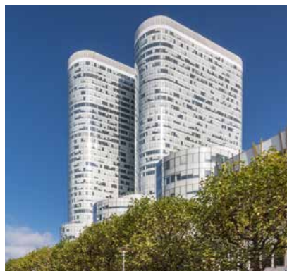
5/7 Esplanade du Gal de Gaulle - Cœur Défense - 92400 Courbevoie