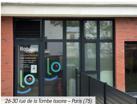
26-30 rue de la Tombe Issoire – Paris (75)