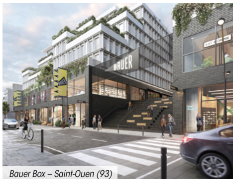
Bauer Box – Saint-Ouen (93)