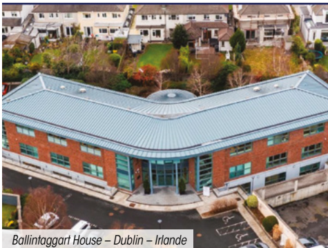
Ballinagart House – Dublin – Irlande

La SCPI n'a enregistré aucun arbitrage ce trimestre.