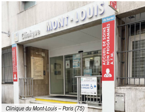
Clinique du Mont-Louis – Paris (75)